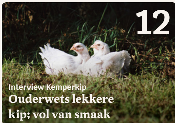
Interview Kemperkip Ouderwets lekkere kip; vol van smaak